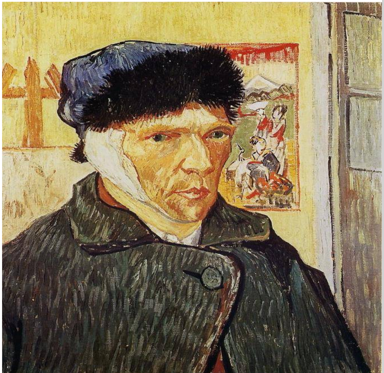
Van Gogh /Autoportrait à l'oreille bandée /1889/60 x 49 cm/Courtauld institute of art